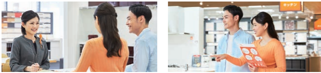
コーディネーターと一緒に見学