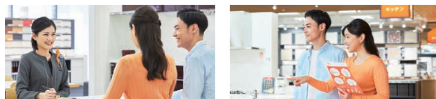
コーディネーターと一緒に見学